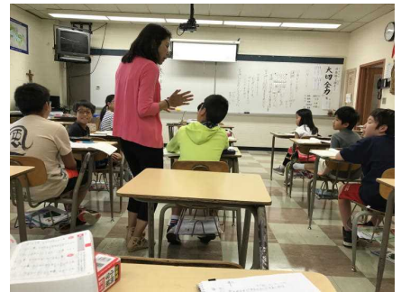
【俳句作りに取り組む5年生】

その後、各自ノートに書いてきた「短い文」を基に俳句作りに挑戦しました。初めの5文字を何にするかしばらく考えてノートに書いてみて、指を折りながら字数を確かめて作っていました。先生から、「気持ちを表す言葉なるべく使わず、表現を工夫しましょう」という指示が出る。「楽しかった」は6文字だし使えないなあなど表現する言葉をいろいろ考えている様子が見られました。できあがった作品には、夏休み中の体験が盛り込まれていました。「海釣りで ピチピチピチと はねる鯛」「おいしいな スイカを食べて一休み」「ひっこしの じゅんぴいっぱい がんばるぞ」